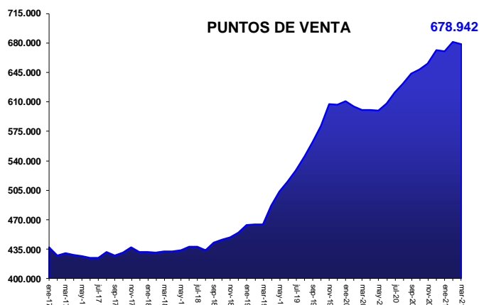
Cifras preliminares