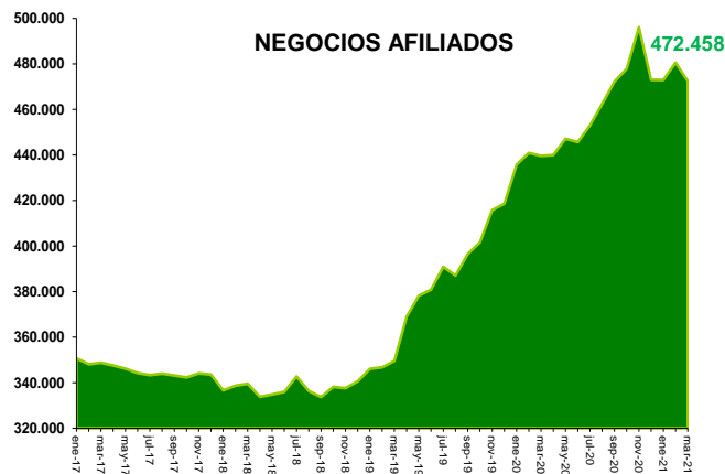
Cifras preliminares